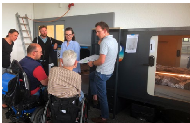
Discussion animée lors du test d'un prototype de cabine pour un capsule-hôtel

Le Centre suisse a déposé en 2021 un recours contre l'arrêt « Victoriaplatz » planifié le long de la future ligne de tramway Berne-Ostermundigen. Il s'est avéré ultérieurement qu'il n'était pas le seul à l'avoir fait. À cause du nombre élevé de recours, les autorités et les planificateurs ont revu le projet de fond en comble. Désormais, l'arrêt de tram cité plus haut est accessible sans obstacles sur toute sa longueur aussi dans le sens centre-ville. Le succès de cette négociation est très satisfaisant pour le Centre.